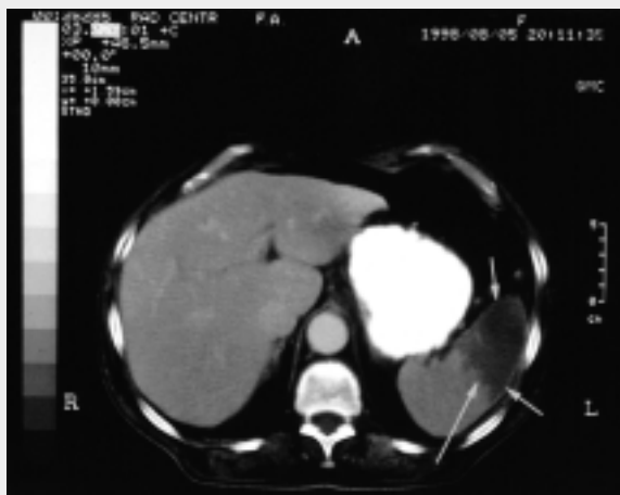
Figura 1. La tomografia computerizzata dell'addome con mezzo di contrasto mostra una densità disomogenea del tessuto splenico con grossolane aree ipodense nelle porzioni antero-inferiori suggestive per infarto splenico interessante circa il 50% dell'organo (freccette).

La paziente era trattata in modo conservativo (digossina, enalapril, furosemide) e fu iniziato un trattamento anticoagulante con warfarin.