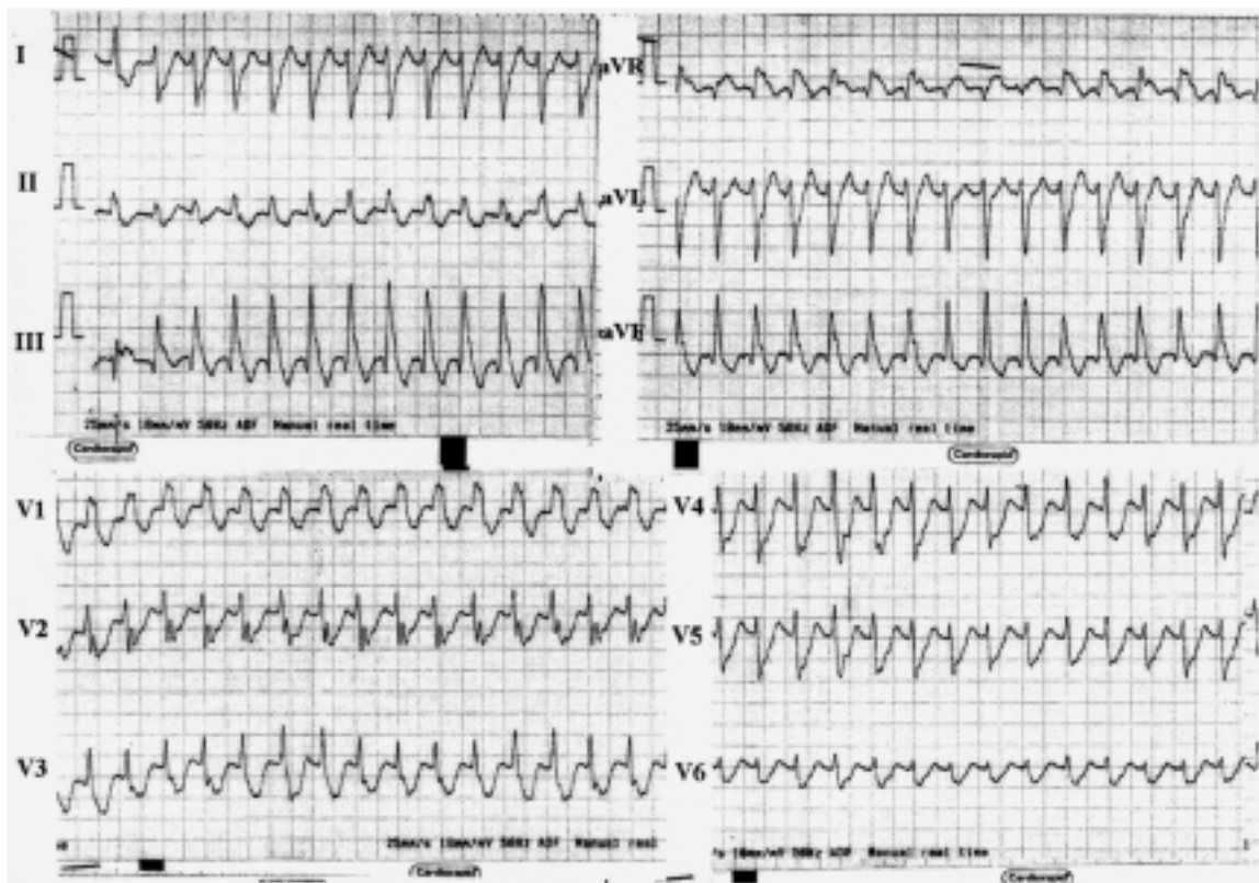
Figura 1. Tachicardia a QRS largo al primo ECG a 12 derivazioni eseguito in Pronto Soccorso.

Appena giunto in rianimazione il marito presenta invece un altro episodio tachiaritmico, con contestuale perdita di coscienza e del controllo sfinterico e scosse tonico-cloniche; viene sedato, intubato e ventilato meccanicamente. Dopo poche ore il ripristino del ritmo sinusale e la scomparsa dei sintomi neurologi-