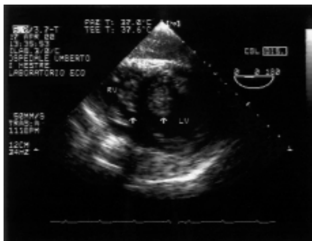
Figura 2. Sezione transgastrica per la visualizzazione dell'asse corto dei due ventricoli; le frecce indicano la presenza di trombi in entrambe le cavità. LV = ventricolo sinistro; RV = ventricolo destro.