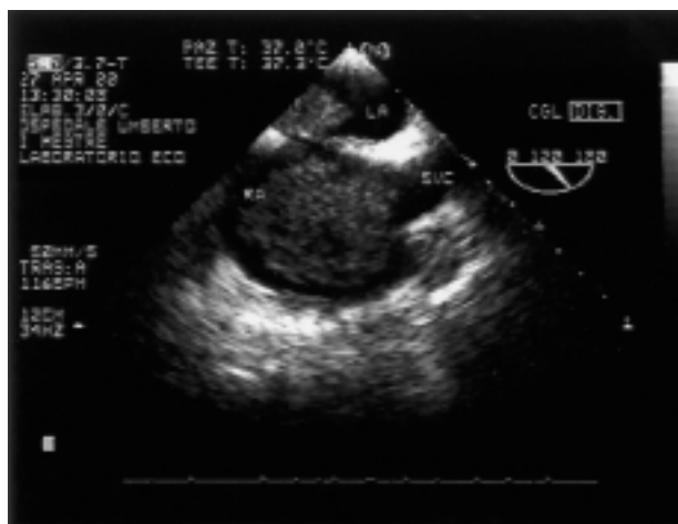
Figura 3. Sezione sagittale con visualizzazione del setto interatriale e della vena cava superiore (SVC): è evidente la marcata voluminosità del trombo in atrio destro (RA) che occupa quasi completamente la cavità. LA = atrio sinistro.