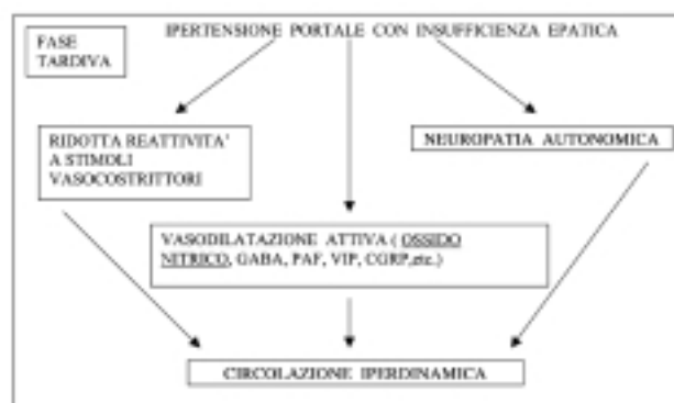
Figura 3. Patogenesi della sindrome circolatoria iperdinamica nelle fasi tardive della cirrosi epatica. Nelle fasi avanzate della malattia epatica la circolazione iperdinamica raggiunge la sua piena espressione clinica: i determinanti fondamentali sono rappresentati da una ridotta reattività a vari agenti vasocostrittori, dalla vasodilatazione, indotta principalmente dall'ossido nitrico, e dalla neuropatia autonoma. La concomitanza di tali alterazioni porta, quindi, ad una drastica riduzione delle resistenze periferiche ed in ultima analisi alla circolazione iperdinamica conclamata. CGRP = calcitonin gene-related peptide; GABA = acido gamma-aminobutirrico; PAF = fattore di attivazione piastrinica; VIP = peptide vasoattivo.

La comparsa della sindrome circolatoria iperdinamica in corso di cirrosi epatica assume un significato prognostico sfavorevole, determinando un aumento della morbilità e della mortalità dei pazienti che la sviluppano. Llach et al. 59 hanno identificato i fattori di rischio prognostici più significativi in pazienti cirrotici ricoverati in ambiente ospedaliero per un episodio di ascite e poi seguiti in un periodo di follow-up di 12.8 \pm 14.2 mesi.