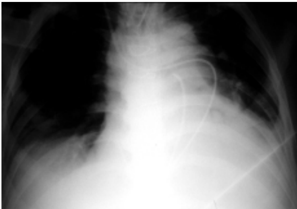
Figura 2. Decorso anomalo del catetere polmonare attraverso la vena cava superiore persistente sinistra.

l'eccessiva lunghezza del catetere introdotto per raggiungere la posizione di incuneamento e la riduzione dell'ampiezza, fino alla quasi scomparsa, della morfologia della traccia atriale destra, avrebbero potuto indurre al sospetto clinico della presenza dell'anomalia congenita 7,8 ; non ci sono state invece apprezzabili alterazioni nei parametri monitorizzati, a differenza di quanto osservato in condizioni analoghe da altri autori che hanno segnalato valori abnormemente elevati 7 o abnormemente ridotti 8 di gittata cardiaca, misurata con la termodiluizione, in relazione all'eventuale presenza di fenestrazione del seno coronarico o all'anomalo posizionamento della porta atriale del catetere polmonare 7,8 .