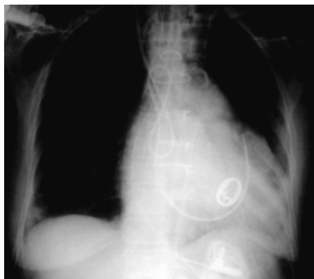
Figura 1. Presenza di anse del catetere localizzate in vena cava superiore e atrio destro.

In 45 pazienti portatori di pacemaker definitivo il posizionamento del catetere in arteria polmonare non ha comportato malposizioni di elettrodi endocavitari né fenomeni di intreccio dei cateteri; il cateterismo polmonare è stato comunque eseguito con un periodo di latenza rispetto all'impianto di pacemaker di almeno 6 mesi. La posizione finale della punta del catetere è stata il ramo principale dell'arteria polmonare di destra nel 92.4% dei casi e il ramo principale di sinistra nel rimanente 7.6%. In un paziente sottoposto a sostituzione valvolare aortica il decorso anomalo del catetere polmonare, evidenziato dalla radiografia del torace, ha indirizzato la diagnosi di "persistenza di vena cava superiore sinistra senza agenesia della vena cava superiore destra", altrimenti misconosciuta (Fig. 2). In tal caso