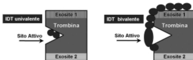
Figura 2. Meccanismo d'azione degli inibitori diretti della trombina (IDT) monovalenti e bivalenti.

Si possono distinguere IDT bivalenti e monovalenti a seconda che siano capaci di legarsi sia al sito catalitico sia all'esosite 1 o soltanto al sito catalitico 1 (Figura 2). Gli IDT bivalenti sono l'irudina ricombinante (lepirudina e desirudina) e la bivalirudina, mentre quelli monovalenti sono il melagatran/ximelagatran (metabolita attivo e profarmaco rispettivamente), l'argotran e il dabigatran.