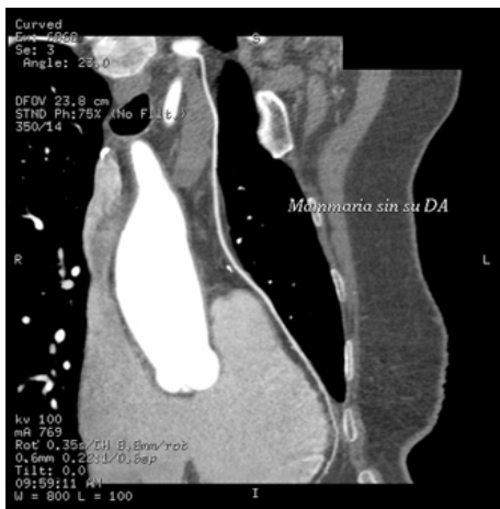
Figura 2. Stessa paziente della Figura 1 studiata in multiplanare curva. DA = discendente anteriore.