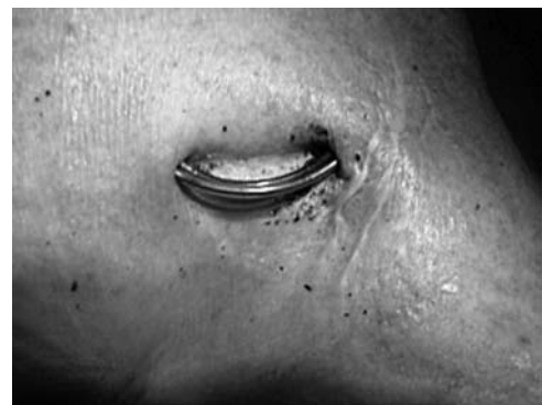
Figura 1. Esempio di esteso decubito del catetere stimolatore.

li che sistemiche, dopo l'impianto di un PM definitivo. Tra i principali fattori che contribuiscono allo sviluppo delle infezioni in questo ambito bisogna annoverare tutte quelle situazioni che determinano uno stato di immunodepressione relativa del paziente, quali diabete mellito, neoplasie, insufficienza renale cronica, denutrizione o terapie protratte con steroidi e/o immunosoppressori 13 . Inoltre l'ematoma della tasca di impianto costituisce un ottimo terreno per la crescita batterica, così come la terapia con gli antagonisti della vitamina K può favorire l'insorgenza di infezioni (Figura 1). Anche fattori locali, quali il ritardo della cicatrizzazione della ferita, la necessità di riposizionamento in acuto dell'elettrocatero e/o l'eventuale presenza di cateteri abbandonati e la trombosi venosa lungo il de-