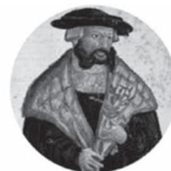
De Historia Stirpium