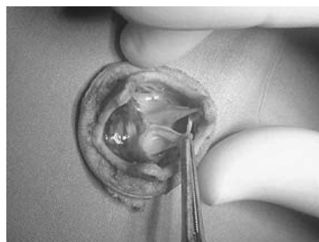
Figura 3. Reperto operatorio della valvola espantata con visualizzazione del cedimento commissurale di una delle cuspidi della bioprotesi Carpentier-Edwards impiantata in sede mitralica.

Il primo impianto di una protesi biologica di maiale Carpentier-Edwards è stato effettuato nel 1978 1 .