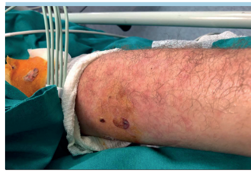
Figura 2. Lesioni cutanee riscontrate in un paziente di 56 anni con forma severa di sindrome da distress respiratorio acuto da COVID-19, che ha richiesto ventilazione invasiva, ricoverato nell'Unità di Terapia Intensiva Cardiologica della nostra Azienda Ospedaliera.

Osservazione comune di vari patologi è stata quella di aver rilevato trombosi macro e microvascolari, sia sotto forma di trombi "rossi", formati da eritrociti, leucociti e fibrina, che "bianchi", formati da piastrine e fibrina. I microtrombi di piastrine e fibrina sono stati individuati nelle venule, arteriole, capillari di tutti gli organi maggiori, anche a livello mesenteriale 10 .