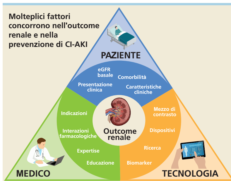
Figura 2. Principali fattori coinvolti nell'outcome renale dei pazienti sottoposti a procedure diagnostiche o interventistiche endovascolari con utilizzo di mezzo di contrasto iodato. CI-AKI, danno renale acuto da mezzo di contrasto; eGFR, velocità di filtrazione glomerulare stimata.